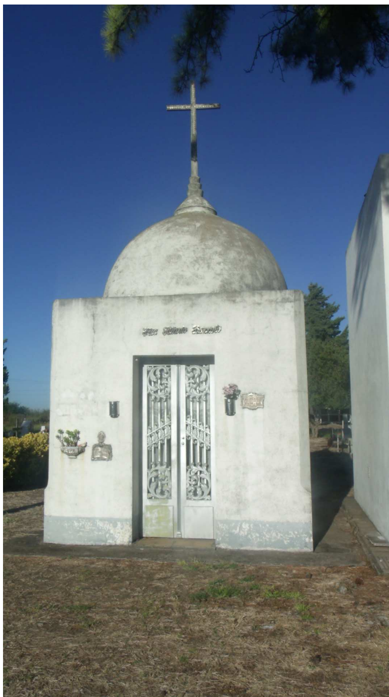
PANTEÓN DE DON HILARIO BOZZOLO TUMBA HISTÓRICA MUNICIPAL SEGÚN ORDENANZA N° 54/2013

PANTEÓN DE DON HILARIO BOZZOLO TUMBA HISTÓRICA MUNICIPAL