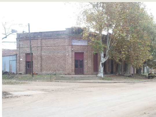
Casa Flia Aquiles Gatti