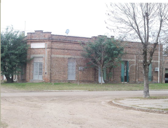
Casa Ex Flia Anselmo Madoz