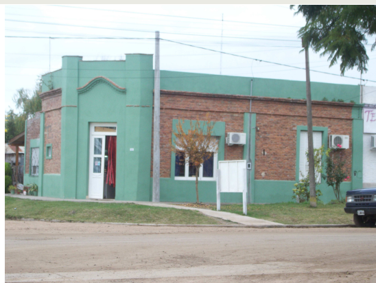
Casa Ex Flia Gatti

AÑO 2 NÚMERO 014 ORDENANZA N° 02/2012 30 DE JUNIO DE 2013