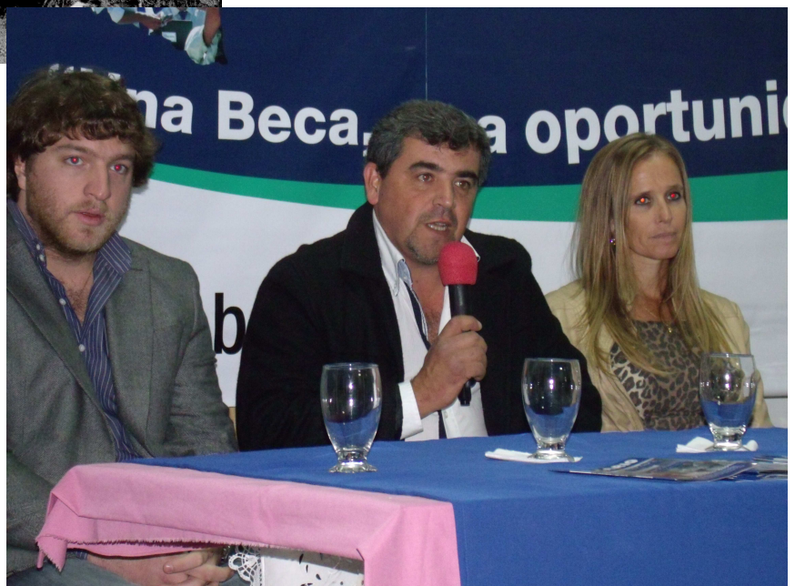
Acto de Entrega de Becas 2013