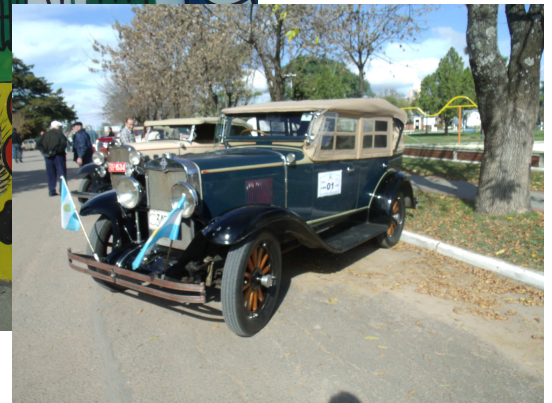
Carrera de Autos Antiguos