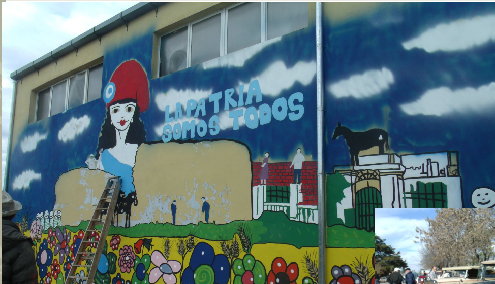
Mural del programa “Que florezcan mil murales”

AÑO 2 NÚMERO 013 ORDENANZA N° 02/2012 31 DE MAYO DE 2013